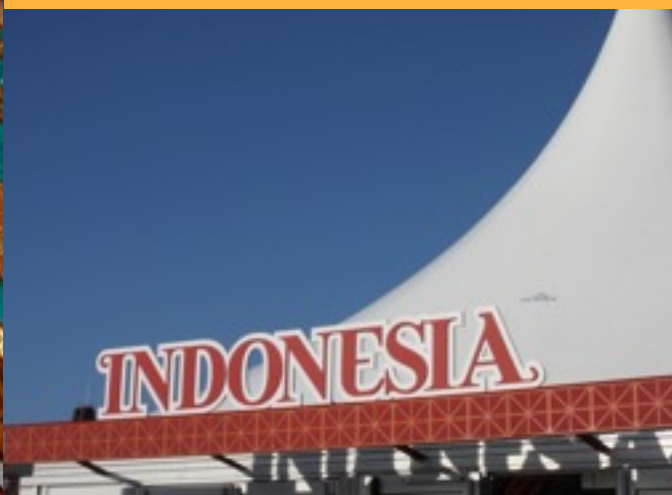
Entree Pasar Malam Indonesia.

Indisch 3.0 mag vijf keer twee vrijkaarten weggeven, voor een bezoek op 5 of 7 april. Wil jij daar kans op maken? Check dan op 9 maart onze website!