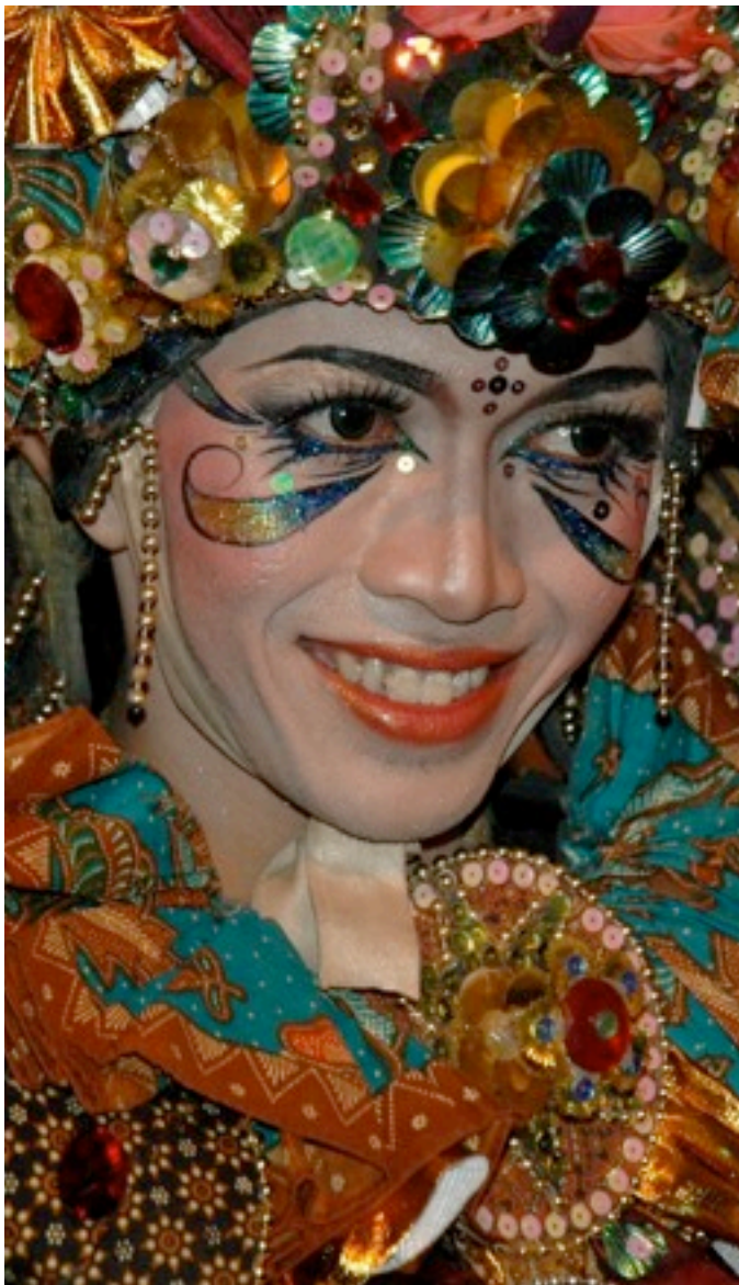
Pasar Malam Indonesia 2010. Foto: Natalie Ypma (2010)

Pasar Malam Indonesia 2011 Malieveld, Den Haag, 1-7 april